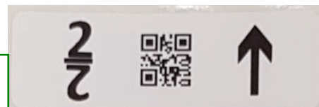
Abb.3 Bsp. Fach-Code „2“ an der Anlage

Mittlerweile gibt es die praktischeDACOS