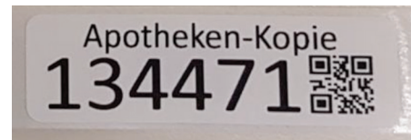
Abb.2 PIN-Code für die Apotheke als Aufkleber . Ein automatischer Kunden-PIN-Code aus dem Kassensystem kann optisch anders aussehen, siehe oben*.

Den zweiten PIN-Code und QR-Code ( Apotheken-Kopie ) kleben Sie auf Ihre Abholbon-Kopie oder Ihr Kassensystem druckt ihn automatisch aus. Damit können Sie die Ware sicher dem Hinterlegungsfach zuordnen.